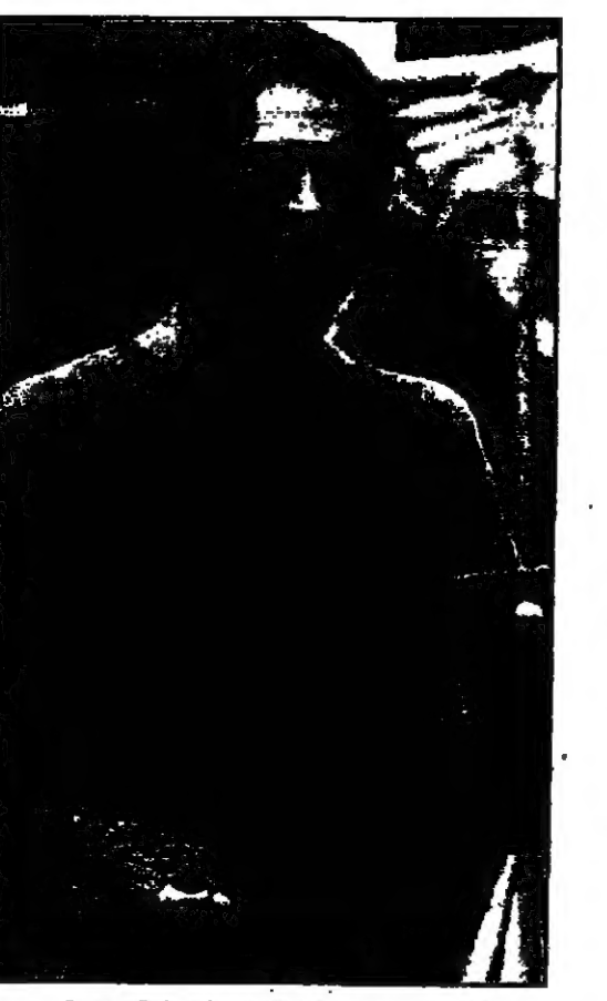
بول نيكلوس في دور جو ويكس المصاب بالجنون

لندن - والقدس العربي - من ناصر ياسين: يعتبر مسلسل «ايست اندون» أحد أشهر المسلسلات التلفزيونية (سوب أوبرا) في بريطانيا، حيث يبلغ عدد الذين يشاهدون حلقاته الأسبوعية الثلاثة في محطة تلفزيون الـ 5 بي بي سي نحو 22 مليون شخص.